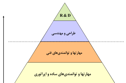
نمودار ۲- هرم توانمندی توسعه تکنولوژی

از مهم‌ترین مشکلاتی که اجرای طرح ژنریک به وجود آورد می‌توان عدم کیفیت دارو، عدم قدرت رقابت در سطح بین‌الملل، عدم وجود نوآوری و تحقیق و توسعه، عادت به حمایت‌های انحصاری، عدم ارتباط با مراکز آموزشی و تحقیقاتی، اقتصادی نبودن قیمت‌ها، عدم توجه به صادرات، مهاجرت نیروی آموزش دیده داروسازی به دلیل عدم استقبال از نوآوری و نبود زیرساخت تحقیق و توسعه، ناکافی بودن تخصص مدیریت و بهار ۹۰، دوره چهاردهم، شماره اول