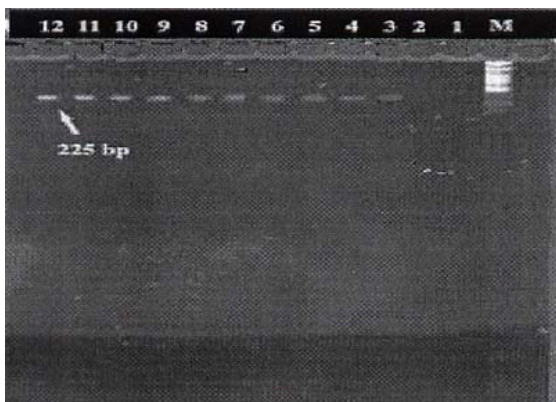
شکل ۲ - نتایج PCR در مورد رقت‌های مختلف PCR