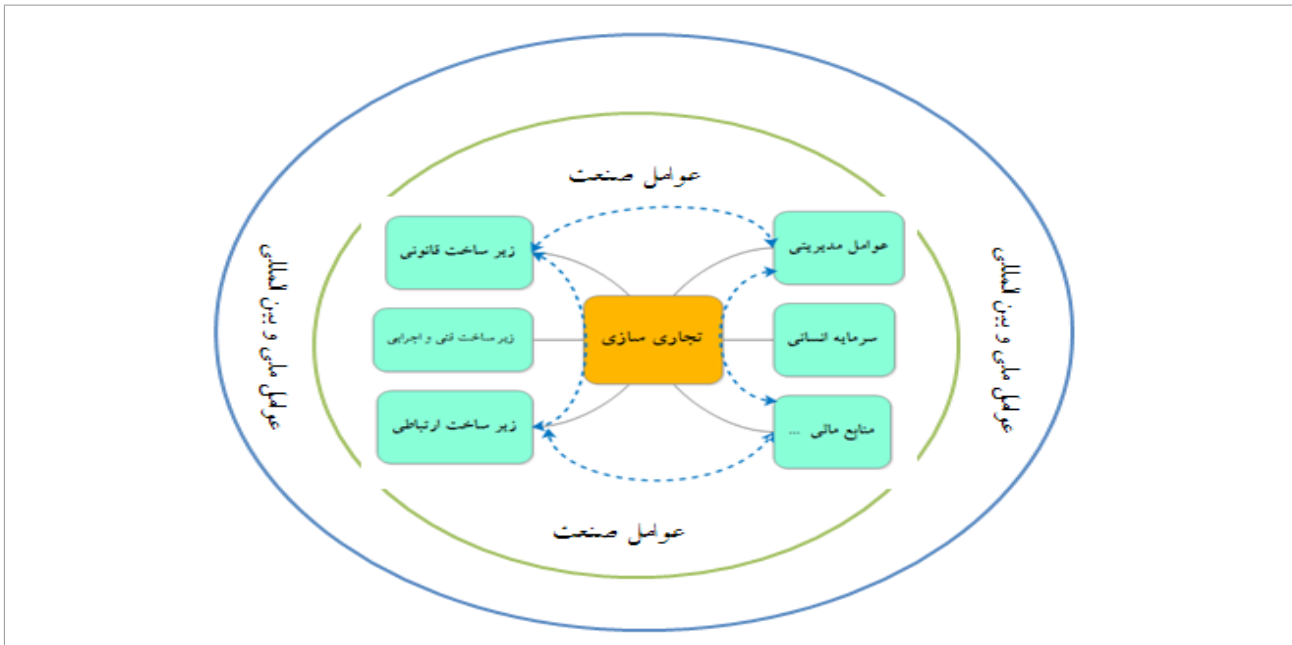
شکل ۴: مدل مفهومی تحقیق

در تمامی مراحل، عوامل و شاخص‌های مختلفی بر این فرایند اثر می‌گذارند که چنانچه شناسایی شوند، می‌توانند در قالب یک چهارچوب و بسته ارزیابی به تولیدکنندگان و