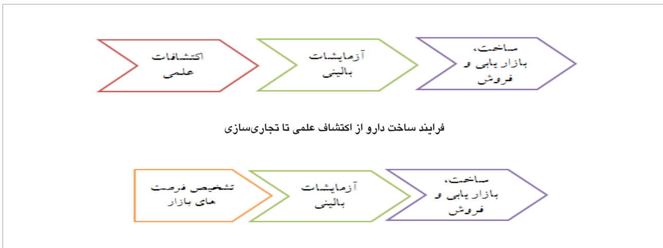
شکل ۳: فرایند ساخت دارو از تشخیص فرصت بازار تا تجاری‌سازی

با بهره‌گیری از مدل‌های مطرح شده می‌توان به این جمع‌بندی رسید که کلیه فرایندهای حوزه دارویی، چه در حوزه صنعت بیوتکنولوژی و یا صنعت مادر، از یک فرایند مشخص به‌شرح زیر تبعیت می‌کنند: فرایند تولید دارو با رویکرد «تولید مولکول» سه