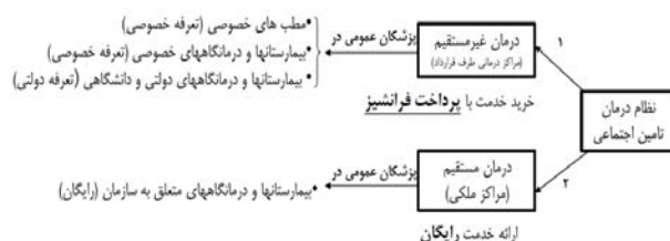
شکل ۱- نظام درمان سازمان تأمین اجتماعی و ارائه‌کنندگان مختلف خدمات ویزیت پزشک عمومی با تعرفه‌های مختلف

در سازمان تأمین اجتماعی طی سال ۱۳۸۸ حدود ۱۰۰ میلیون ویزیت توسط پزشکان عمومی انجام شده است که قریب به ۱۰٪ از منابع بخش درمان را به خود اختصاص داده است (۱۴). نظام ارجاع در نظام درمانی سازمان تأمین اجتماعی، جایگاهی نداشته و بیماران برای استفاده از خدمات سطوح بالاتر و تخصصی نیازی به ارجاع پزشک عمومی ندارند. به عبارت دیگر بیماران محدودیتی برای مراجعه به سطوح مختلف خدمات درمانی ندارند (۱۵). در این سازمان، این خدمت با تعرفه‌های متنوع (رایگان، دولتی و خصوصی) و از طریق ارائه‌کنندگان مختلف مطابق شکل ۱ ارائه می‌گردد.