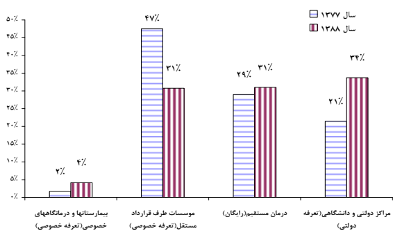
نمودار ۲- متوسط مراجعه به پزشک عمومی و سهم هر یک از آرایه‌کنندگان در سال‌های ۱۳۷۷ و ۱۳۸۸