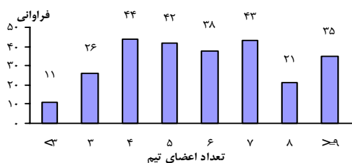
نمودار ۱- نمودار ستونی فراوانی اعضای تیم‌های ارتقاء

شاخص‌های ارزیابی در ۵۹/۳٪ موارد، نتیجه‌محور و در ۴۰/۷٪ فرآیندمحور و در ۵۰٪ موارد اختصاصی همان فرآیند بود. در ۱۴/۷٪ موارد استراتژی انتخاب شده متناسب و اختصاصی نبود و در ۶۳/۹٪ موارد معیارهای اولویت‌بندی راهکارهای ارتقاء، خوب نبودند. در ۴۵٪ موارد امتیازدهی در جدول اولویت‌بندی درست انجام نشده بود و در ۲۰/۶٪ موارد، برنامه تغییر با استراتژی همسو نبود. در ۱۳/۴٪ موارد جدول اولویت‌بندی کاملاً درست و در ۸/۹٪ کاملاً غلط و در بقیه موارد از یک صحت نسبی برخوردار بود. میانگین اعضای تیم ۵/۸ نفر (۶/۱-۵/۵) بود (نمودار ۱).