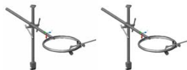
شکل ۱- طرح کلی مجموعه رترکتور

مکانیسم اتصال ستون عمودی به ریل تخت جراحی؛ مکانیسم اتصال بازوی افقی به ستون عمودی؛ مکانیسم اتصال راهنمای تیغه به حلقه نگهدارنده؛ مکانیسم اتصال دنباله تیغه به راهنمای تیغه.