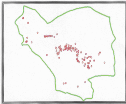
شکل ۱- موقعیت جغرافیایی خانه‌های بهداشت و امکان مشاهده اطلاعات توصیفی در شهرستان بجم

- تعیین حریم بیماری‌ها به منظور تعیین میزان شیوع و پیشگیری از انتشار آن به مناطق هم‌جوار همان‌طور که مشاهده می‌گردد یکی از کاربردهای GIS مشخص نمودن وضعیت بیماری روی نقشه جغرافیایی است به نحوی که هنگام ضرورت می‌توان موارد بیماری با مکان وقوع آنها را به‌طور هم‌زمان روی نقشه جغرافیایی مشاهده و علل و عوامل بروز و شیوع آنها را با توجه به اطلاعات توصیفی بررسی و مشخص کرد؛ در حقیقت منبع ایجاد بیماری و چگونگی بروز و انتشار آن را به‌طور پیوسته پیگیری نمود و جهت رفع علل مربوط به پدیده‌های محیطی و پیشگیری و کنترل بیماری چاره‌اندیشی کرد. تجزیه، تحلیل این مسأله و یافتن راه حل مناسب با استفاده از ابزار GIS به بهبود مدیریت بهداشت و درمان منطقه و ارتقای سلامت مردم ساکن در آن منطقه کمک خواهد نمود (شکل ۲).