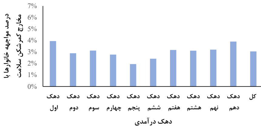
نمودار ۲- درصد مواجهه خانوارها با مخارج کمرشکن سلامت در سال ۱۴۰۲؛ خانوارهای شهری