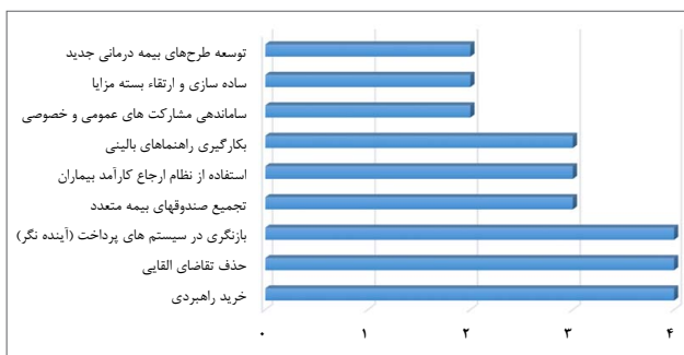
نمودار ۳- پرتکرارترین راهکارهای تأمین مالی پایدار نظام سلامت در کشورهای توسعه یافته

۳۸ مطالعه در بازه زمانی ژانویه ۱۹۹۱ تا اکتبر ۲۰۲۲ میلادی به بررسی روش‌های تأمین مالی پایدار نظام سلامت کشورهای توسعه‌یافته پرداختند. بیشتر مطالعات در سال‌های ۲۰۱۰ تا ۲۰۲۱ میلادی انجام شدند (نمودار ۲). این مطالعات بیشتر در کشورهای انگلستان، کانادا، آمریکا، آلمان، اسپانیا،