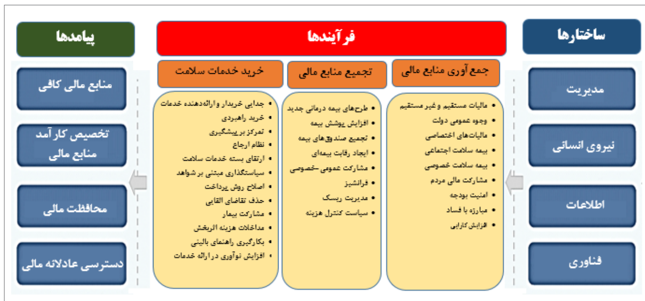
نمودار ۴- مدل نظام تأمین مالی پایدار سلامت در کشورهای توسعه یافته