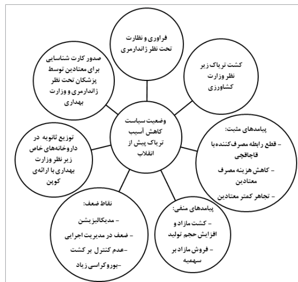
شکل ۱- وضعیت سیاست‌های کاهش آسیب تریاک پیش از انقلاب

کدهای اصلی استخراج‌شده در این دسته، در شکل ۱ نمایش داده‌شده‌اند.