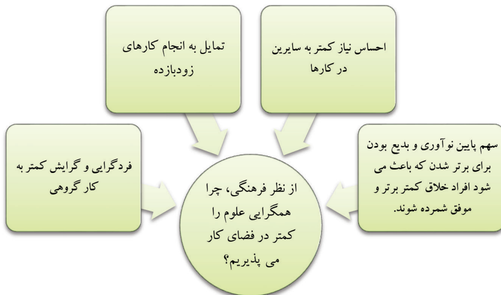
شکل ۲- موانع فرهنگی توسعه‌ی ارتباطات میان‌رشته‌ای

متأسفانه فرهنگ غالب سازمانی و البته فرهنگ عمومی جامعه به‌سمت همگرایی علوم نیست. شاید مهم‌ترین آسیب‌ها در این قسمت به‌شرح زیر باشد: