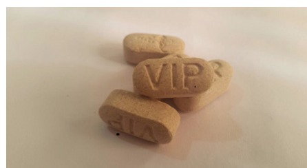
شکل ۲- قرص‌های موسوم به VIP ساخته شده از پودر ترامادول

جدول ۱- مشخصات دموگرافیک و اطلاعات درمانی ۱۴ مددجوی مراجعه‌کننده به یکی از مراکز درمان سوءمصرف مواد شهرستان کرج که سابقه قبلی از مصرف مواد مخدر نداشته و صرفاً از داروهای دست‌ساز عطاری‌ها جهت درمان مشکلات پزشکی خود استفاده کرده‌اند