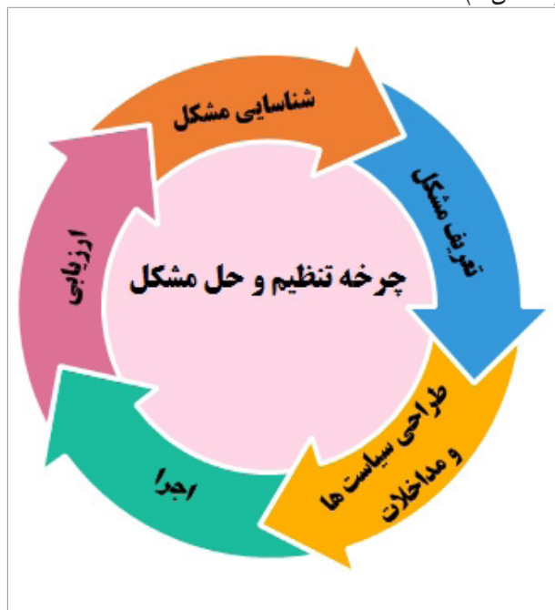
شکل ۲: چرخه تنظیم و حل مشکل

ساختار مشارکت بین‌بخشی از طریق یک فرایند مشارکتی و تصمیم‌گیری جمعی اقدام به شناسایی و تعریف مشکلات، طراحی و اجرای مداخلات برای حل این مشکلات و درنهایت ارزیابی مداخلات می‌نماید؛ فرایند مذکور به صورت چرخه‌ای عمل نموده، در هر مرحله از فرایند، امکان بازگشت به مرحله قبل وجود دارد (شکل ۲).