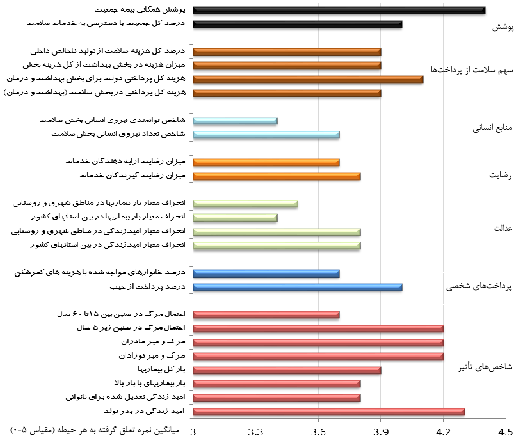
نمودار ۱- میانگین نمره گروه‌های مختلف شاخص‌ها به تفکیک نوع شاخص در هر گروه

نمودار ۱، میانگین نمره گروه‌های مختلف شاخص‌ها را به تفکیک وضعیت هر شاخص در هر گروه نشان می‌دهد. نمودار ۲، میانگین نمره گروه‌های مختلف شاخص‌ها را به تفکیک امتیاز در هر معیار نشان می‌دهد. همانطور که نمودار ۲ نشان می‌دهد از